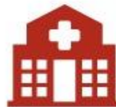
Access to health services